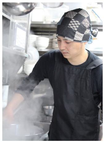
● そば作りは時間との闘い