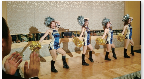
● ブレクシーによるダンスパフォーマンス