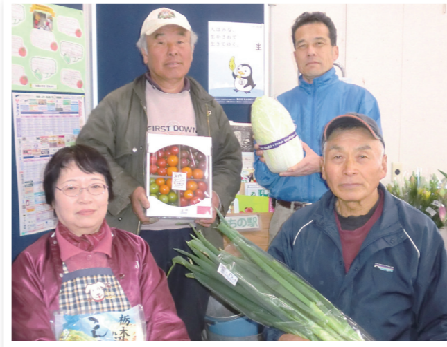
● 自慢の農産物を手に！組合理事の方々