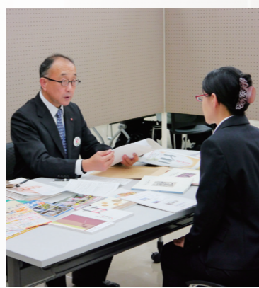
●企業担当者も面接者も真剣な眼差しです