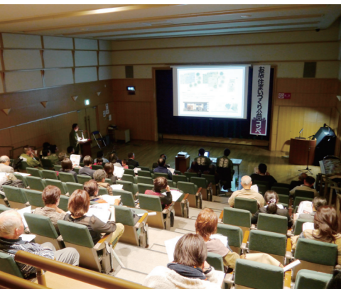
●第2回お店・住まいづくり公開コンペ

Commercial Building & Home Building Competition