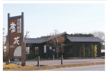
● 大きな看板が目印

店頭の広い駐車場に車を停め、手入れの行き届いた坪庭を眺め、店内に足を運びます。ぬくもりを感じる木のテーブルは、和紙のランプシェイドが優しく照らし、大きく開いた窓から、山野草や樹木の配された四季折々の中庭も楽しむことが出来ます。 この日頂いたのは「ふた汁そば」。出汁の効いた熱々のつけ汁に薬味を入れて大きなチャーシューにひと箸つけると、柔らかくほぐれ、そっと口に運ぶとジューシーな味が広がります。おそばをつけ汁に軽くつけて