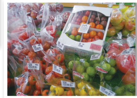
● 冬はゆっくり育つため「甘味」「栄養」が凝縮されてるそうです！