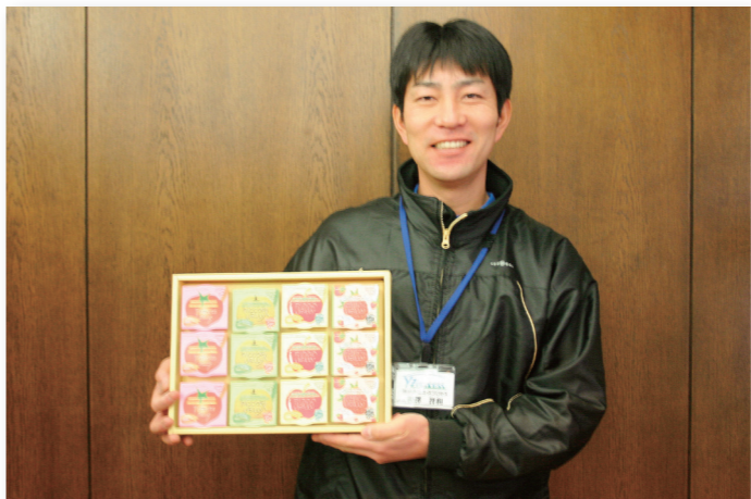
●現在は、トマト、りんご、いちごを加えた4種類のラインナップ。 まちの駅 新・鹿沼宿、ニューサンピア栃木でお買い求めいただけます。 【お問い合わせ】(株)ユーズプロセス ☎(0289)65-8563