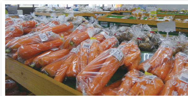
● 「旬」な野菜、くだものがいっぱい！

恵まれた自然環境で育てられた地元産の新鮮な農産物が勢ぞろいした野尻直売所。農産物以外にも花やお総菜、加工食品など豊富に取り揃え低価格で提供しています。店内はいつでも旬な野菜や果物がいっぱい！今の季節のおすすめは何といっても「莓」！店頭には並ぶ量も多く、甘さも格別！そして同じく赤い果実の