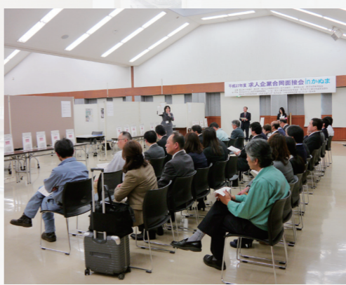
●事前説明に熱心に耳を傾ける企業担当者

求人企業合同面接会は、人材を必要としている企業と求職者が出会うチャンスです。今後も商工会議所は求人企業と求職者との架け橋となるべく事業を展開していきます。来年度も開催予定ですので、また多くの企業の参加をお待ちしております。