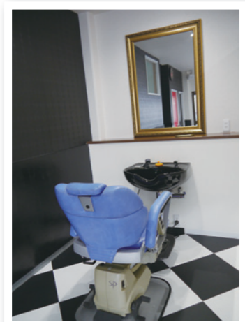
● ハーフ個室でゆったり