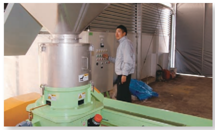
● 初公開! 堆肥ペレット製造マシン