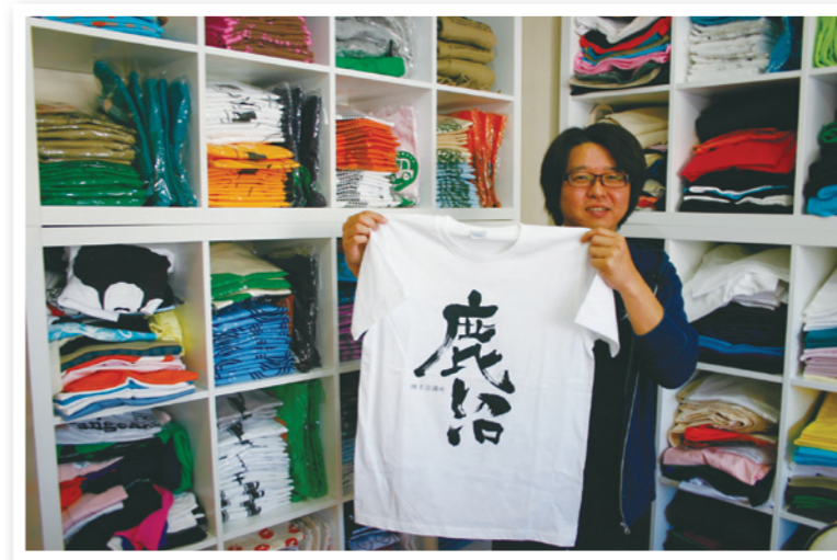
● 限定? 鹿沼商工会議所70周年記念Tシャツ!