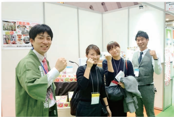
●平成28年2月3日(水)～5日(金) 東京ビッグサイトにて開催の「第81回東京国際ナショナル・ギフト・ショー春2016(同時開催・中小企業総合展・feel NIPPON 春 2016)」に現在も継続的に出展中!