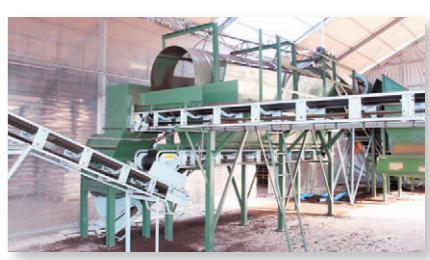
● こちらの機械はH26「ものづくり補助金」で導入