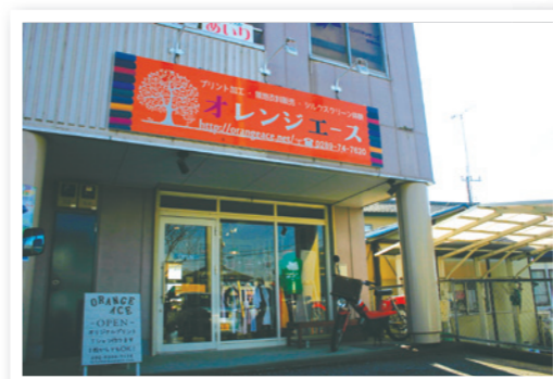
● 店名の通り、オレンジ色の看板が目印