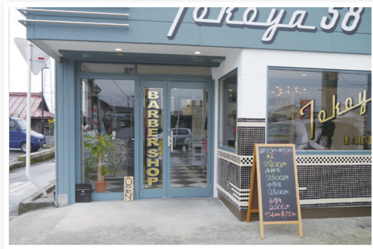
● 歓迎。鹿沼街道沿い店舗