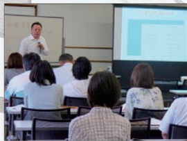
●マイナンバーセミナー

ともに、商工会議所が持つ経営支援のハブ機能を活かし、専門家等との連携により経営基盤強化を図ります。 また、引き続き日本商工会議所と連携してマイナンバー制度の普及と消費税の適正な転嫁を支援するための事業を実施します。