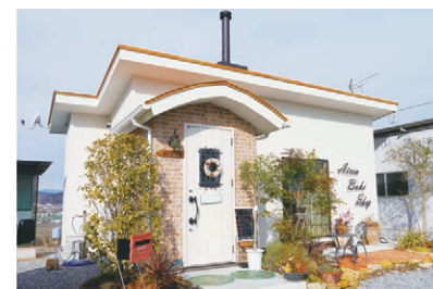
● 家族の絆が詰まったお店の名前のロゴマークが目印