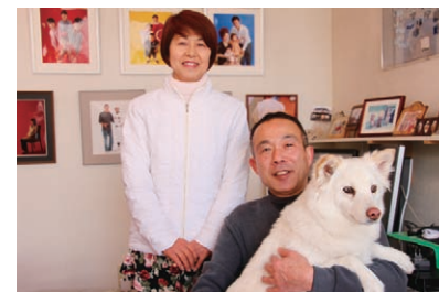
● もう一人の家族(ペット)と一緒に写真を撮ろう!!

古い写真や大切な写真の修復やアルバムも製作行います。写真で、困ったときは、お気軽にご来店・ご相談して下さい。すべて解決してくれます。フォトウイングさんでした。