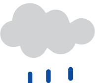
平成27年8月～平成28年1月の景況感(小雨)

上半期の停滞感がさらに強まり、個人消費が改善しないなどの弱含みの動きを示した。原材料価格の高騰、原油価格の下落、世界経済の減速感等の要因のほか、日銀が実施したゼロ金利政策など不透明要因から景気への影響が懸念される。