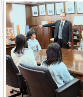
●ミニかぬま会頭訪問