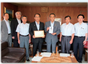
●毎月100件以上の会員企業を訪問し、鹿沼の景況感をお聞きしながら、会員企業の声による施策実現を図ります。

題の政策 提言につ いては関 連団体等 と共同で 要望活動 を行うよ うな取り 組みを行います。