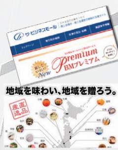
●地域を味わい、地域を贈ろう。

行政、金融機関、ものづくり・まちづくりグループ等と情報の共有化を図りながら製品開発の支援、展示会・商談会への参加やインターネットを活用したネット販売等の販路開拓を支援します。また、会員企業の相互交流による連携を深めながらメディアアプリシティをはじめIT活用による会員企業紹介と販売促進支援事業を展開します。