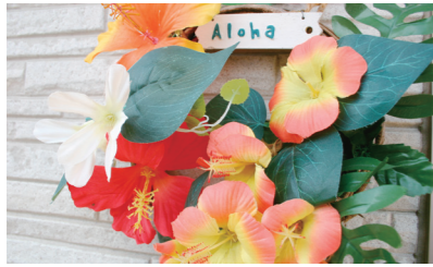
●ハワイの代表的な花「ハイビスカス」がお迎え

身体の不調は精神面から。そう考えるハワイアン伝統の癒しが、疲れ切った現代の私たちの身体に深くしみ渡ります。日頃お疲れのあなた!体験してみたいかがでしょうか? (君島 記)❖