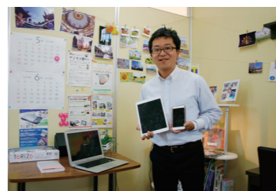
●ちょっとしたトラブル、お悩みもOK!