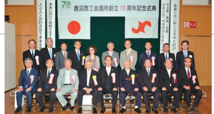
●各表彰者による記念撮影

この度の式典にあたり、ご多忙のなか多くの方々のご臨席を賜り、盛大に開催できましたことを厚く御礼申し上げます。当商工会議所は、昭和21年11月22日に、483名の有志によって設立されました。この70年の歴史のなかで、商工会議所設立に寄せた先人諸賢の熱い思いは、確実に深く醸成され今日の我々に引き継がれ、近年の激動の時代にあつて、地域総合経済団体である商工会議所の役割もますます重要となっております。創立70周年にあたり、これまでの歩みを振り返り、関係各位に深く感謝と敬意を表するとともに、今後の発展を目指す新たなスタートとなるよう、全国515の商工会議所のネットワークを活かしながら、鹿沼地域のさらなる活性化を推進して参ります。今後とも皆様のご支援とご協力を賜りますようお願い申し上げます。