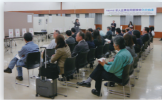
●求人求職合同面接会(平成27年11月6日)

の事業支援をお願いしたい。 (1)求人求職合同 面接会・企業見学会開催の継続実施 (2)特定創業支援 事業への支援 (3)農林商工連携事業への支援