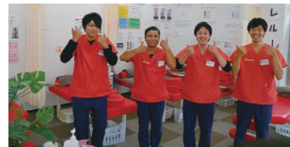
●楽しいスタッフがお待ちしております