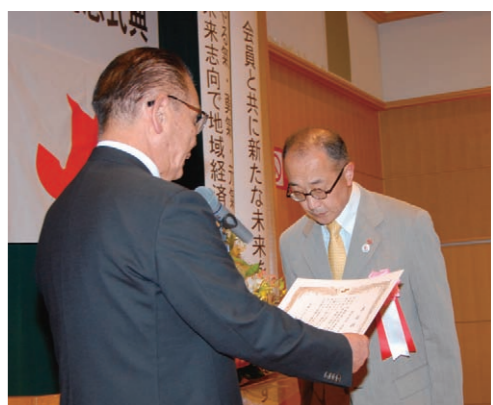
●新事業創出企業の表彰