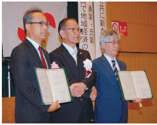
●3団体による、経営支援連携協定締結

この式典では、商工会議所としての今後5年間の経営計画も発表されました。「やる気・勇氣・元氣」のコンセプトのもと、未来志向で挑戦・支援をするため、組織力のアップや福利環境、企業に合わせた販路開拓などについて、具体的な数字目標が掲げられました。さらに、個社の支援