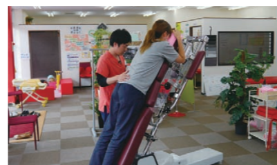
●骨盤矯正のトムソンベッド

タッフが姿勢分析から、身体の改善すべき点や治療プランなどを提案してくれます。当院では、骨盤矯正にトムソンベッドを利用。矯正させたいところを数cm程度持ち上げ、ストン!と落とすことで、体にほとんど負担をかけることなく矯正することができます。施術の際ドン!!ドン!!と結構な音があるので、最初はちょっとびっくりしますがそれが正しく矯正されている証だそうです。