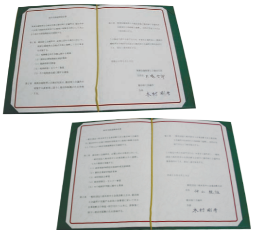
●経営支援連携協定書

我が社は今年で創立50年を迎えます。さまざまな時代の流れのなかで、いかにして会社の舵を取っていかかが常に問われて参りましたが、日頃から自分のあるべき姿を追求し、向上心を持ち続けることが、理想に近づき原動力でもありました。今後新たな技術の開発や、高品質の維持・継続といった比類なき高スタンダードと、ブランド化の構築を目指し、進化し続けていきたいと考えます。