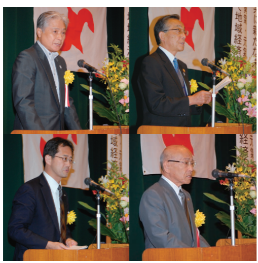
●福田知事(左上)、佐藤市長(右上)、北村県連合会会長(右下)、三村日商会頭代理(左下)による祝辞