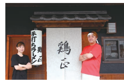
● のれんと提灯が目印