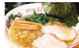
● 手打ち中華(白醤油)

現在、多くのお客様からリクエストのある「テイクアウト」の準備を進めているとのこと、12月初旬には