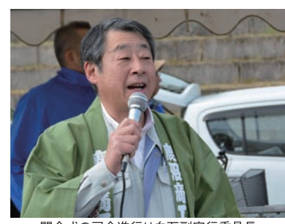
開会式の司会進行は白石副実行委員長