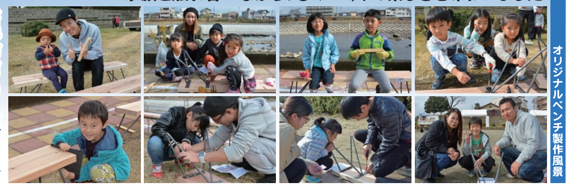
オリジナルベンチ製作風景

鹿沼の未来を担う子どもたちが 家族と触れ合いながら、ものづくりの楽しさを味わいました