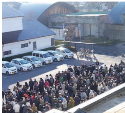
●早朝から買い求める方の長蛇の列

1596名でした。また、7割の方が購入限度額の10万円の申込みでした。この結果11月18日に行った事前申込分の抽選での当選倍率は7.8倍となり、商品券発行事業の若林実行委員長によるコンピュータのランダム抽選で369名の当選者が決定しました。当選者には「購入引換券」が郵送され、11月27日(日)から12月2日(金)の期間内で商品券を購入していただきました。また、12月3日(土)は事前申込分を除いた7千7百万円を当日発売分として販売しました。午前9時からの発売にも拘らず、早朝から長蛇の列ができ、販売開始から1時間足らずで完売となりました。(担当…保木山)