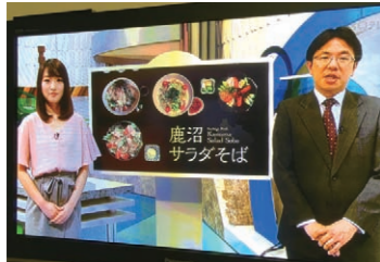
●とちテレさんでもクローズアップ!

「何これ?」「どこで食べられるの?」見た方に疑問を持たせるポスターに加え、SNSによるクチコミ重視の情報発信、店頭にはのぼり、POP、スタンプリーパー帳も兼ねた「鹿沼サラダそば図鑑」を配し、様々な角度から