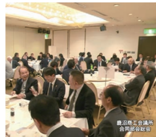
●各部会とも活発な意見交換がなされました

4月24日(月)、福田屋百貨店鹿沼店コンベンションホールに於いて、84名の参加者で8部会合同部会総会が開催され、各部会の事業計画が決まりました。詳細につきましては、広報誌等で順次ご案内いたします!(担当:君島)