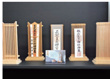
鹿沼組子の技法を生かした「シンプルなお神札立」も人気