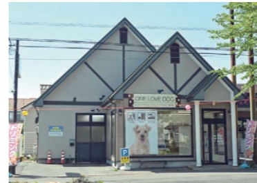
目印はワンちゃんの大きな写真とレンガ造りの建物