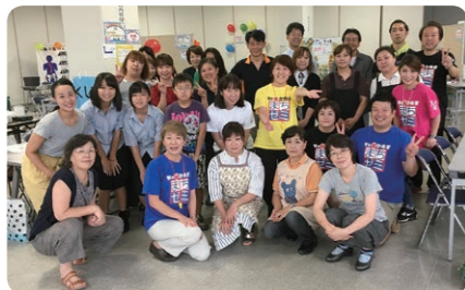
●まちゼミキッズ、多くの方が行動しています

●今後の販路開拓事業 ●千束商店街(台東区浅草)「アナンテナショップ」への出店・募集中 平成31年2月21日(木) 2月26日(火) ●詳細お問合せ 商工会議所 振興課