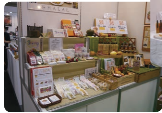
●瓶詰工房Funky pineと健康食研究所

素材の良さを引き出したジャム、平均糖度10を超えるフルーッとマトを加工したスプレッドやビネガー、スカイベリーやなつおとめのジャム、HALALに対応したクッキーなど高品質・高付加価値商品がブースを飾り、大手百貨店・リゾートホテルを中心とした来場者との商談を展開しました。