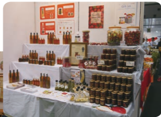
●T-N-Bファームと根本農園

9月4日～9月7日、東京ビッグサイトで開催された食の商談型展示会「グルメ&ダイニングスタイルショー」に会員企業4社で出展しました。