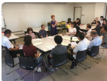
●情報共有、過程も大切

した。鹿沼の成功例等を参考に、県内5カ所でもちゼミが取り組まれており、着実に広がりを見せています。しかしながら、この間にも鹿沼市内のお店を取り巻く環境は、少子高齢化で人口減少が進み、一方ではインターネット販売等による消費の多様化も進み厳しさを増すばかり。まちゼミは、お客様と一緒に楽しい時間を過ごすコミュニケーション事業と言われます。厳しい時代に明日の一手を探すため、お店に足を運んで頂いたお客様と、まちゼミの和やかな雰囲気を活かして、新たな販売方法や、コトを売ることに挑戦してみませんか。 水越