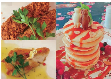
フルコースから軽食、スイーツまで手の込んだ料理が揃う