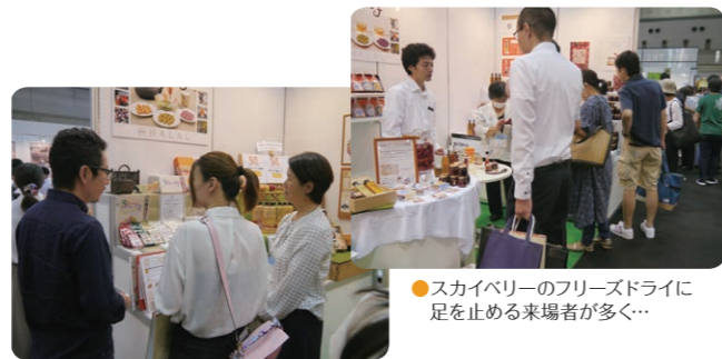
●スカイベリーのフリーズドライに足を止める来場者が多く...