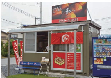
店舗脇に3台分の駐車スペースを確保