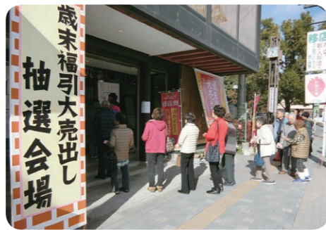
●第63回歳末福引き抽選会場

昭和31年から続く、第63回 鹿沼市商店会連合会の「歳末福引き大売出し」は歴史あるイベントで、市民の皆様にご定着しております。今年も、期間中多くの来場者が訪れ、「当たり」の鐘の音も会場内を盛り上げました。