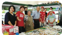
●つまみ食いウオーク