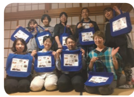
●かぬまグルグルバッグ完成！