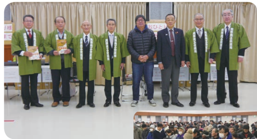
●購入第1号のお客様と