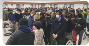
●12月1日当日販売の会場

【ご注意を！】 使用期限は平成31年2月28日 (木迄ですので、ご注意ください。 加盟店様の換金最終日は平成31 年5月31日(金迄となります)。