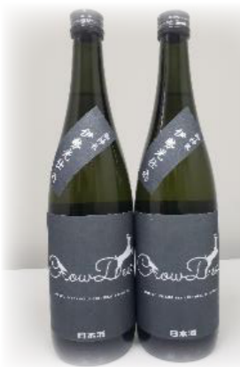
完成した「CrowDeer」を伊勢神宮にご奉納