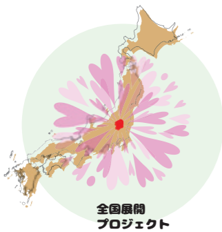
全国展開プロジェクト