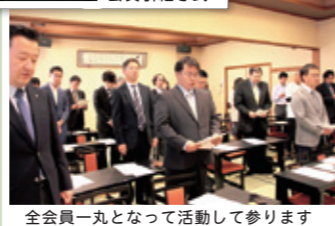
全会員一丸となって活動して参ります