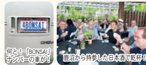
何と！「BONSAI」ナンバーの車が！