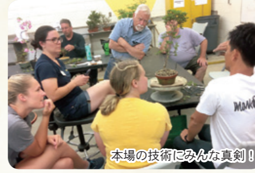
本場の技術にみんな真剣！