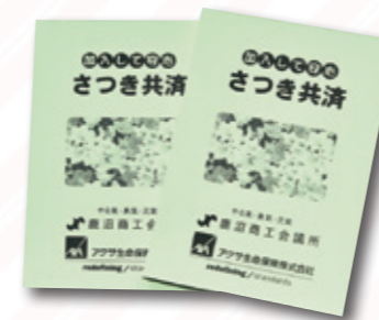
当所オリジナルメモ帳