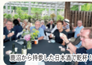
鹿沼から持参した日本酒で乾杯！