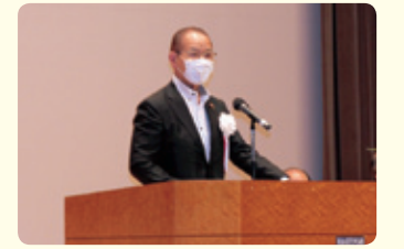
木村会頭による開会のことば