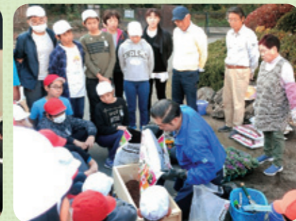
寄せ植え作りの実演