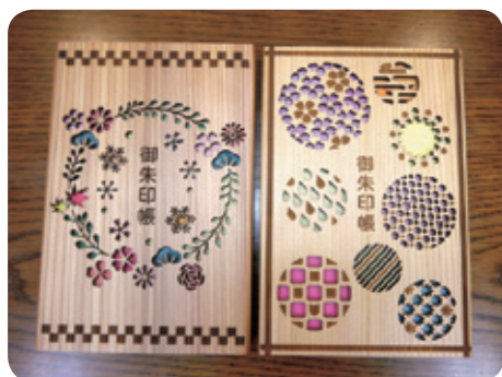
左 風凜(ふうりん)・右 手鞠(てまり)

鹿沼の木工と那須烏山の和紙を融合させた「御朱印帳」が完成しました! デザインは四季折々の自然をモチーフにした「風凜」と「手鞠」の2種類。当所にインターンシップで来ていた鹿沼商工高校の生徒さんに名付けていただきました。 和紙職人により手作業で貼られた色とりどりの「手漉き和紙」、1つ1つ異なる「木目」!この世に1つしかないプレミアム感いっぱいの御朱印帳です。 木箱入り100冊(各50冊)限定で3月発売予定 1冊10,000円(税込)