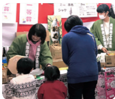
1位は最新家電のホームシアターセット!

昭和31年から続く、鹿沼市商工会連合会の「歳末福引大売出し」が開催されました。 今年で第64回目となる今回は、プレミアム付きニコニコ商品券と鹿沼市商店会連合会が連携し行われ、市民の皆様にも年末の風物詩として広く定着しております。 夢賞は商品券5,000円分が160本、一等賞はホームシアターセットが2本の豪華賞品となりました。 今年も期間中多くのお客様が訪れ、運試しのガラガラポンに挑戦しました。会場は、「当たり」の鐘が鳴り響き、令和最初の歳末福引大売出しは大盛況のうちに終了いたしました。