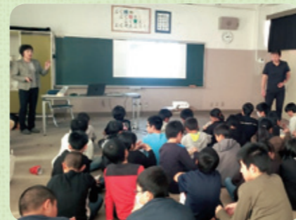
今年もメイン講師を務める設楽部会長

第1部では鹿沼土の生い立ち歴史についての机上学習、第2部では実際に「土」に触れ、寄せ植え作成を実施しました。