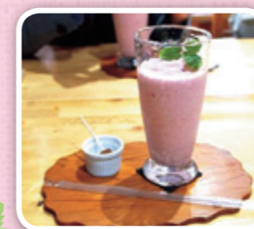
莓(いちご) こんにやく スムージー