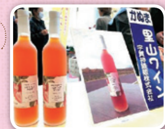
かぬま里山わいんいちごワイン