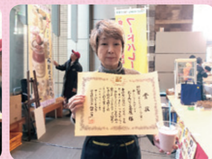
おこんにやく茶屋