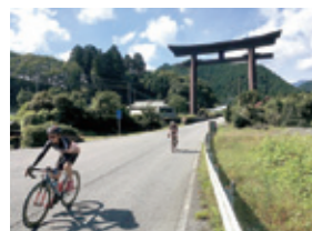
自転車を核としたまちづくり