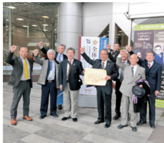
観光振興大会に参加