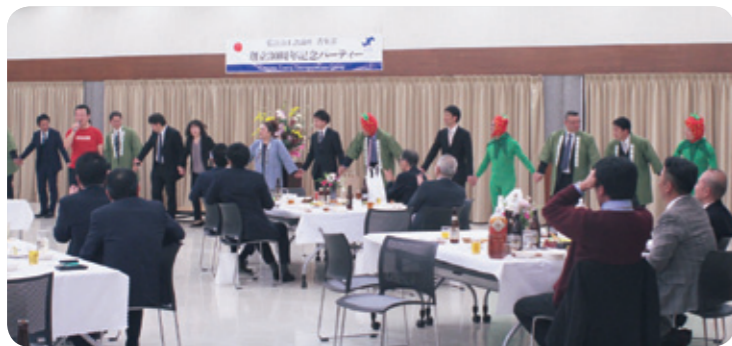
手を取り合い更なる強い絆の青年部を目指して

2月8日(土)に、創立30周年記念式典・記念パーティーを当所大会議室及びアザレアホールにおいて開催いたしました。 当日は日頃よりご支援、ご協力をいただいておりますご来賓、関係者の皆様、親会、OB会員、県内の青年部の仲間をお迎えして開催できたことを深く感謝申し上げます。 また、記念パーティーでは委員会の事業報告やメンバーによる「そば打ち」の実演、日吉囃子保存会様によるお囃子の演奏や県内各単会会長や来賓の方に参加いただいた、「いちごの食べ比べ」など盛会に終えることができました。