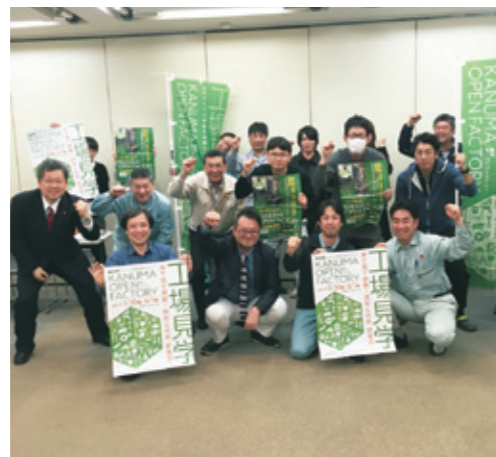
かぬまオープンファクトリー