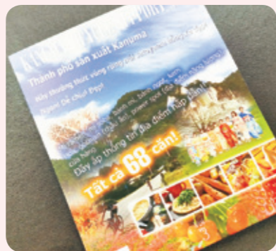
国内初!ベトナム語のサイクリングマップ

商談・採用で海外を訪れる際に、ものづくりのまち鹿沼を知って頂くのにおすすです。市内在住のベトナムの方にもお渡しください。