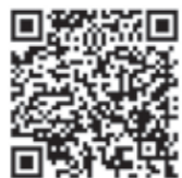
PR 動画をご視聴いただけます！

鹿沼市内には長い歴史とともに培われてきた伝統ある技術・技能の専門職が多く存在します。しかし、これらの多くは後継者不足により技術や技能の継承が進まず高齢化しているのが現状です。 そこで、鹿沼商工会議所では鹿沼市・鹿沼市教育委員会・鹿沼公共職業安定所・鹿沼共同高等産業技術学校と連携し、オール鹿沼で就職希望の中学生と受入企業のマッチング事業を行っています。 受入企業を随時募集しておりますので、技術継承に悩みの企業様のお申込みをお待ちしております。