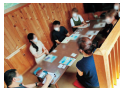
和気あいあいの創業サロン

【夜の部】10/13(水) 12/8(水) 令和4年2/9(水) 18時30分〜