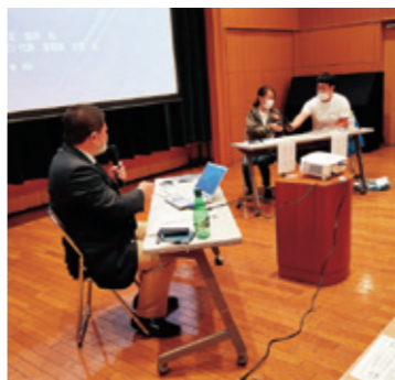
創業経験者のトークセッション