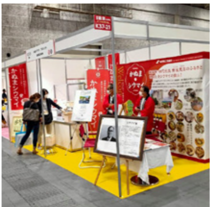
feel NIPPON 展示会

9月29日〜10月1日インテックス大阪で開催された展示会に日本商工会議所と連携し「かぬまシウマイプロジェクト」として出展しました。星野工業、笑福シウマイ、三和物産が出展し新製品をPR、全国への販路開拓も進めます。