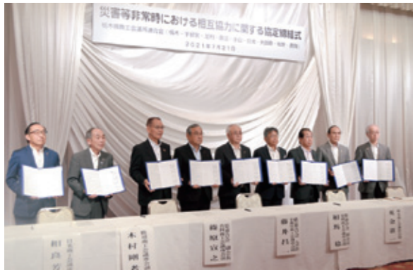
県内商工会議所により締結された協定書