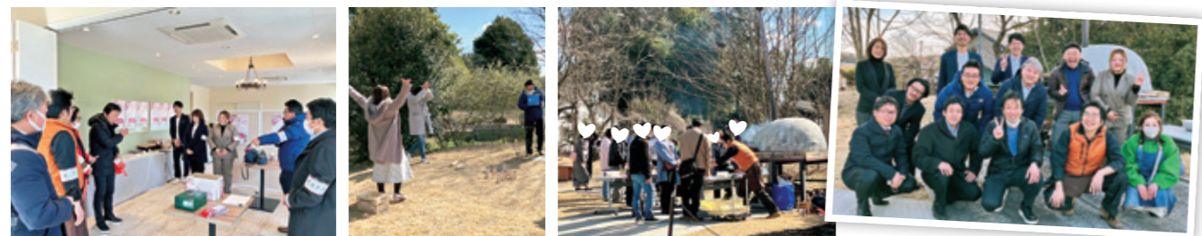
▲念入りに打合せを行うメンバーたち ▲モルックゲームで盛り上がる参加者 ▲ピザ作り体験の様子 ▲ご参加いただきありがとうございました

地域経済活性化の一つとして、鹿沼市が抱える少子化問題や定住の促進に貢献することを目的に、「婚活イベント」を令和6年3月9日(土)に初開催しました。 当初予定していた募集定員30名を大きく上回る50名の参加者のもと、盛大に開催されました。 本格的なピザ窯で焼く「ピザ作り体験」や、木のおもちゃを投げて点数を競う「モルック」ゲーム。『はちみつCafé HoneyB』さんのビュッフェを楽しみながらのフリートークで交流を図りました。 そして嬉しいことに、6組のカップリングが誕生♡おめでとうございます！ ご参加いただいた皆様、そして参加に向けて背中を押して下さった事業所の方々へ、心より感謝申し上げます。 今年度も、企画予定ですので楽しみにしててくださいね。