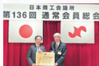
▲ 事業承継の取組で日商より表彰