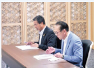
▲ 提言要望を説明する片柳会頭、森田政策委員長