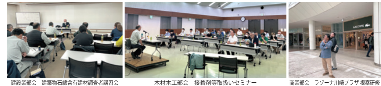
建設業部会 建築物石綿含有建材調査者講習会