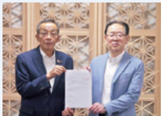
▲ 鹿沼市長へ提言要望

鹿沼市に対する提言要望 鹿沼市 鹿沼市 鹿沼市 国県への提言要望 会員拡大事業の展開による組織基盤の強化 （五三〇千円） 創立80周年事業に向けての体制づくり