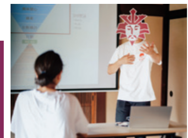
プレゼンする元就社長