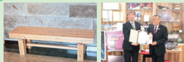
▲鹿沼市文化交流館へ寄贈した木製ベンチ ▲寄贈式の市長と木協連支部長