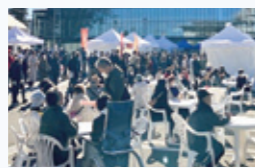
▲ 第1回かぬまシウマイ博覧会

鹿沼名物シウマイ事業 （三、〇〇〇千円） ・ 誘客を誘う食のまちおこし事業 ・ 知財登録 組織づくり、情報発信 ・ かぬまシウマイ博覧会 まちづくり応援事業 （五〇〇千円） 新鹿沼駅前の活性化 まちづくり事業のハード事業整備を推進 南摩ダムの整備と連携した地域の活性化