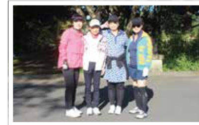
カメラの前でハイチーズ!

10月24日、第38回鹿沼商工会議所会員親睦チャリティーゴルフ大会において、ダブルコンペとして女性会親睦ゴルフ大会を実施しました。参加者は5名と少なめでしたが、秋晴れの下プレーし、親睦を深めました。来年も開催予定ですので、みなさまの参加をお待ちしております。