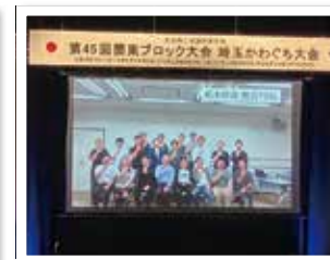
紹介を受ける鹿沼YEGのメンバー達