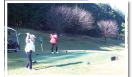
秋晴れの下で良い汗をかきました!