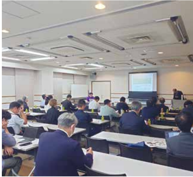
▲宇宙ビジネスについて真剣に聴き入る参加者

金属製造業はもとより飲食業やサービス業など様々な業種の方に参加いただき、これからの宇宙ビジネスについて考える良い機会になりました。引き続き、このプロジェクトを継続予定です。みなさまのご参加をお待ちしております。