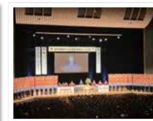
R8年度大会をPRする日立YEG