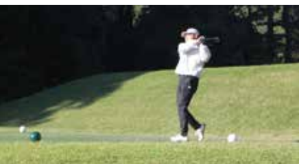
▲青空の下ナイスショット！