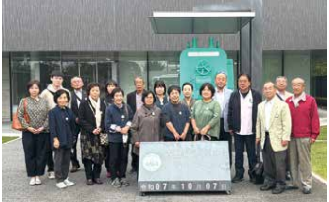
▲貨幣の歴史と技術に触れて

10月7日、理財・サービス部会視察研修会を開催し、18名が国家の財を担う現場、埼玉造幣局を訪問しました。