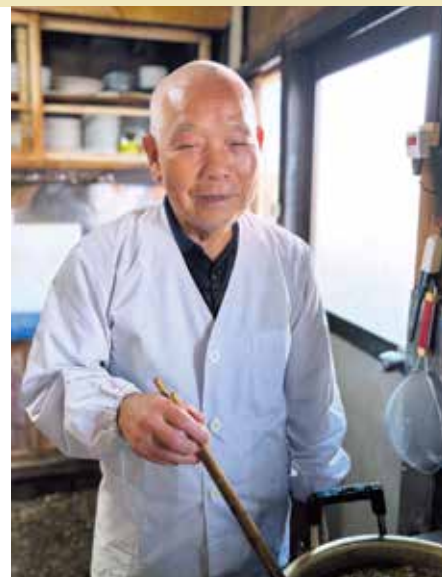
おかえり、と言われた気がした

昔ながらの優しいラーメンやチャーハンも人気ですが、まずはコレ!正楽園の魅力がぎゅっと詰まった味を試してみませんか?井からフワッと立ち上る幸せな香りを、心ゆくまで満喫してください。とっておきの美味しさを是非どうぞ。