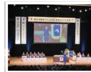
大会旗を掲げる関プロ大会会長

商工会議所青年部の三大事業である「全国大会・全国リーダーズ研修会・関東ブロック大会」は、全国規模でビジネス交流ができる青年部活動の魅力の一つです。ご興味のある方は気軽にお問合せください。