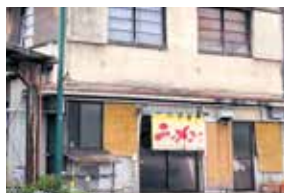
壁の色が語る、旨さの歲月