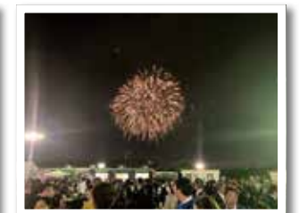
大懇親会「川口花火大会」の様子