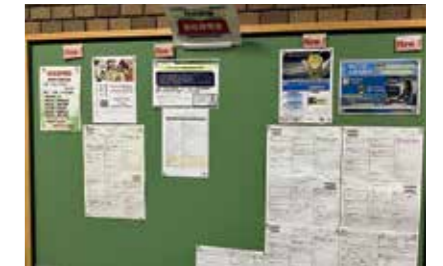
ポリテクセンター栃木の掲示板でPR