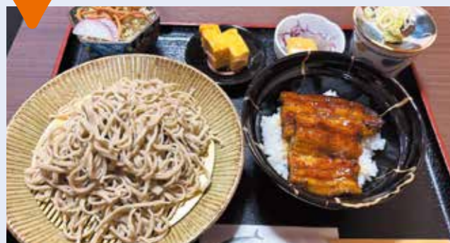
一番人気のうなぎ蕎麦セット