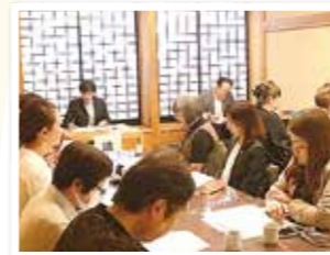
令和7年度定期総会