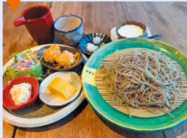
そばランチセット