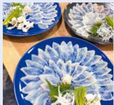
新たなメニューかも