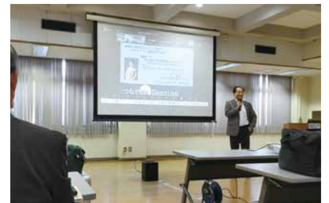
TAMA協会 販路・売上UP分科会